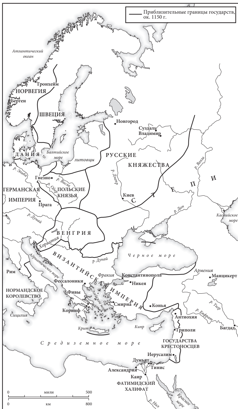
— Карта 5. Восточная Европа в 1150 г.