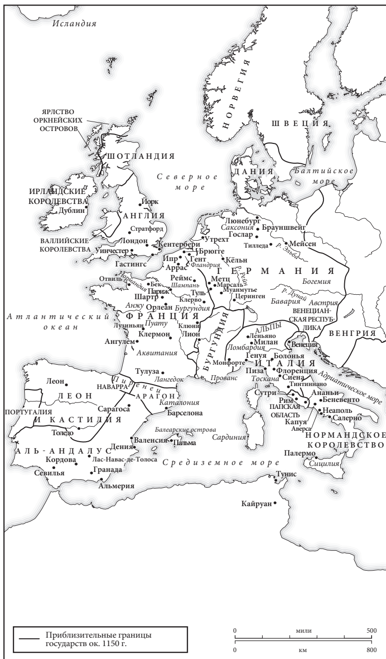
Карта 4. Западная Европа в 1150 г.