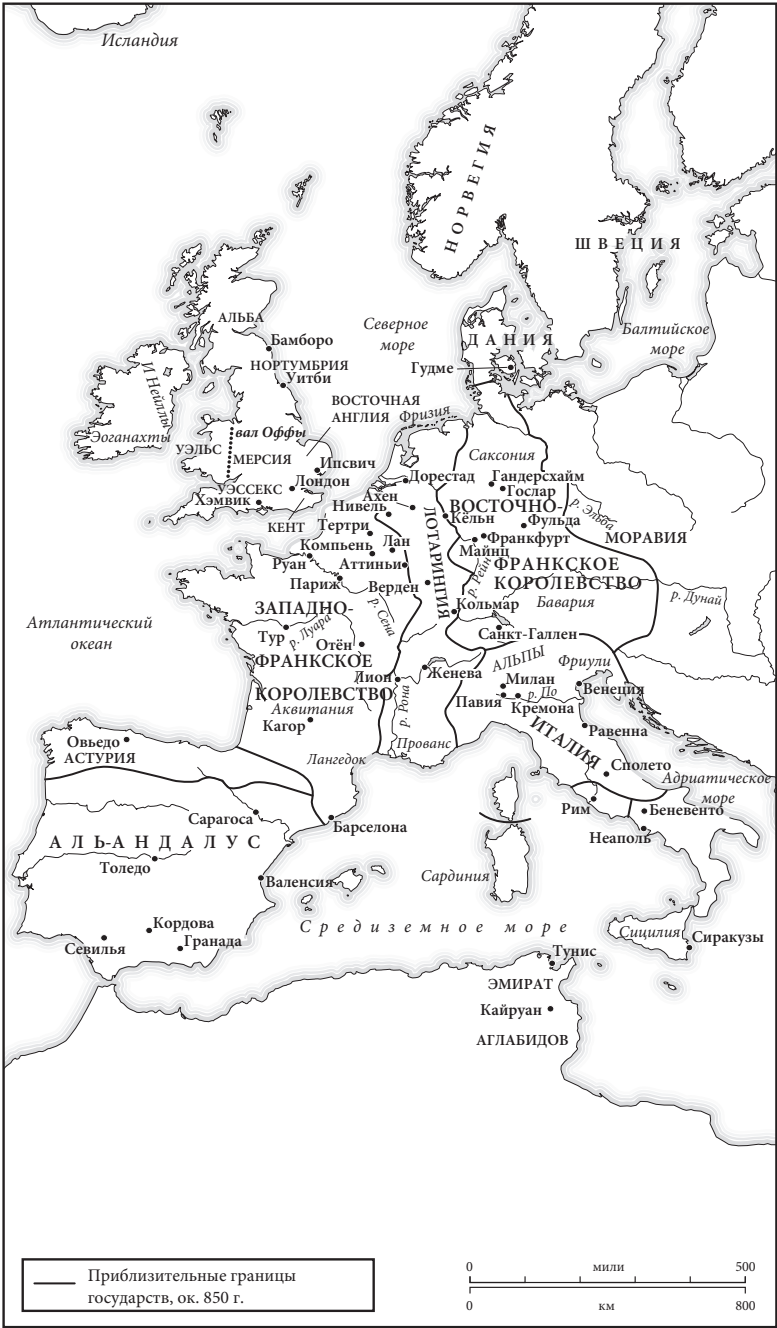
Карта 2. Западная Европа в 850 г.