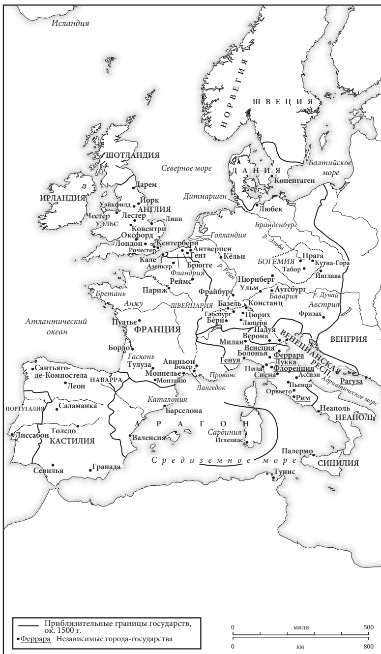
Карта 6. Западная Европа в 1500 г.