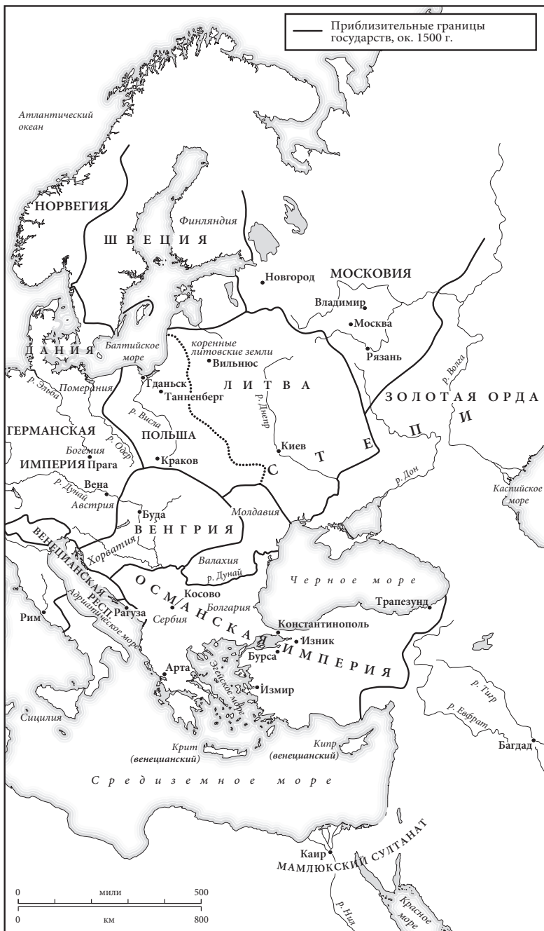
Карта 7. Восточная Европа в 1500 г.