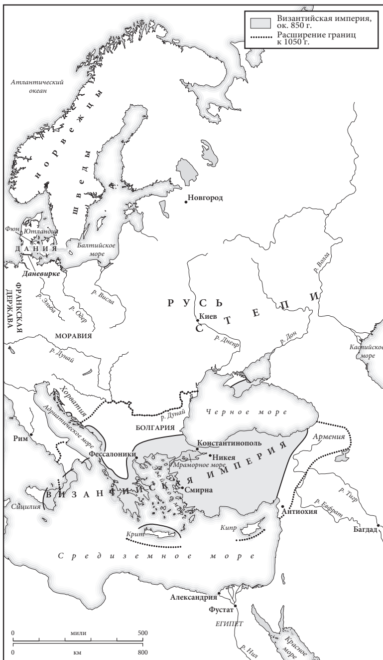
Карта 3. Восточная Европа в 850 г.