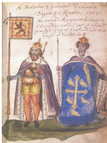
Малькольм и Маргарита

Я сказал «Маргарита», а шотландец сказал бы «святая Маргарита». Ведь эта красивая и умная женщина, одна из двух самых знаменитых женщин в шотландской истории (вторая — это, конечно, Мария Стюарт), принадлежит к числу святых католической церкви. По всей