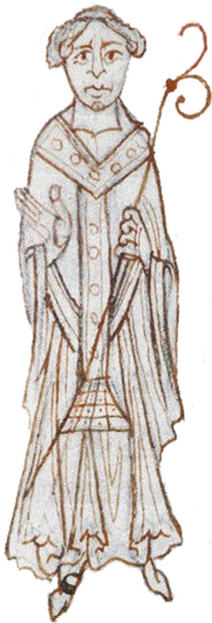
Ланфранк, миниатюра из манускрипта XII века

Большинство епископов и аббатов были также заменены на пришельцев с континента. В частности, лишился своей кафедры и архиепископ