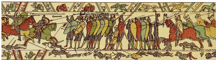
Норманны атакуют «стену щитов», фрагмент гобелена из Байё

Победители долго не могли найти искромсанное тело злосчастного Гарольда. Но вот уже ближе к ночи какие-то монахи привели любимую женщину короля, как бы мы сейчас сказали, его гражданскую жену. Долго бродила по полю прекрасная Эдит Лебединая Шея (Swan Neck) и наконец нашла Гарольда среди обезображенных тел по только ей ведомым признакам. Потом, согласно легенде, мать Гарольда умоляла Вильгельма выдать ей тело сына за огромную плату, но тот велел похоронить его среди безымянных скал на берегу Ла-Манша. Там, как считают патриоты, он и лежит до сей поры, продолжая охранять родной берег от пришельцев с юга.