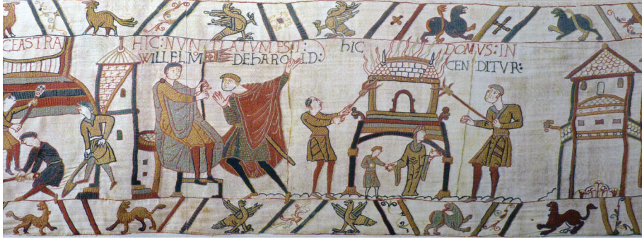
Опустошение севера, фрагмент гобелена из Байё

постройки. Крестьяне бежали из сожжённых деревень в леса и массами гибли от голода и холода. Не менее северной трети Англии превратилось в безлюдный край, который только через полтора века будет возвращён к жизни усилиями цистерцианских монахов. Так Вильгельм преподал урок недовольным и показал, что готов удержать власть любой ценой — а сколько у него останется подданных, уже не столь важно.